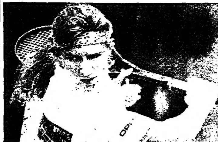
ستيفي غراف في مبارياتها وسيكتفي